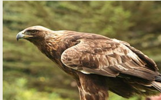
χρυσαιτός ( Aquila chrysaetos )