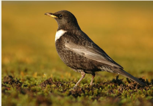
χιονοτσιχλα ( Turdus torquatus )