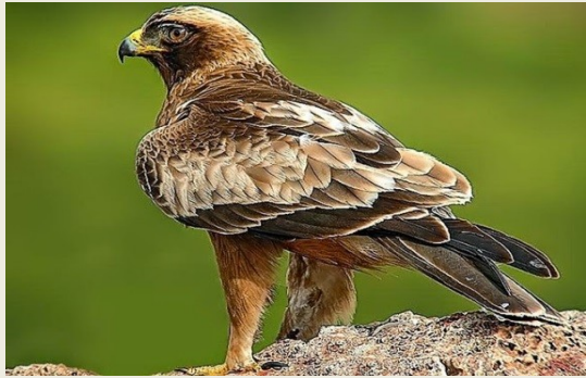
σταυραετός ( Hieraetus pennatus )