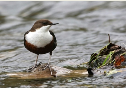
νεροκότσυφας ( Cinclus cinclus )