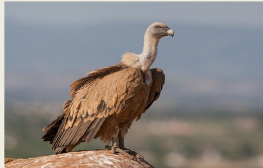
Όρνιο ( Gyps fulvus )