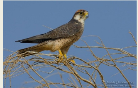
χρυσογέρακας ( Falco biarmicus ).