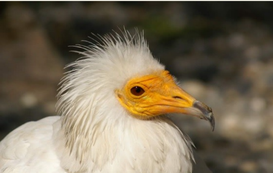
ασπροπάρης ( Neophoron percnopterus )