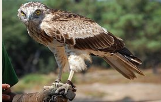
φιδαιτός ( Circaetus gallicus )