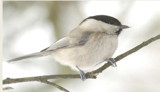
βουνοπαπαδίτσα ( Parus montanus )